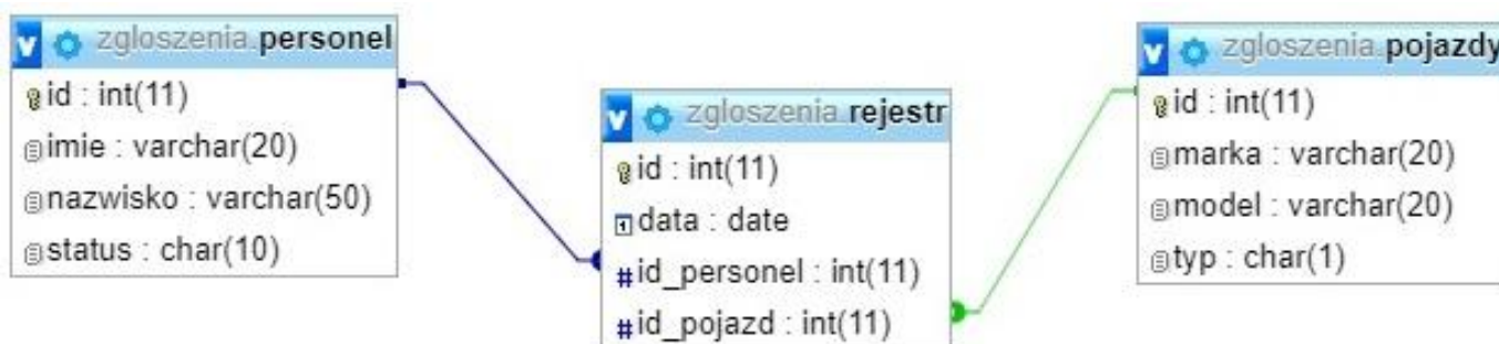
Ilustracja 1. Baza danych

Baza danych zawiera połączone relacją tabele przedstawione na ilustracji 1. Tabele opisują rejestr zgłoszeń oraz przypisane do nich dane dotyczące personelu oraz pojazdów. W polu personel.status znajdują się wpisy: 'policjant' lub 'ratownik'. W polu pojazdy.typ znajdują się wpisy: 'K' lub 'R' oznaczające karetkę lub radiowóz.