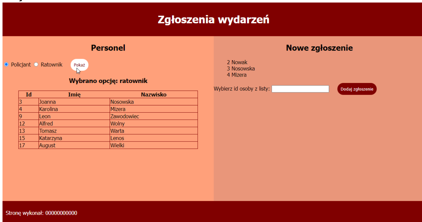
Ilustracja 2. Wygląd witryny internetowej, kursor na przycisku.